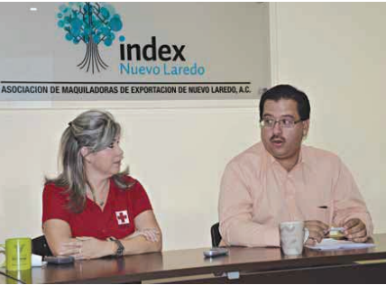
Preparados. El torneo se pondrá en marcha con motivo de apoyar causas altruistas.

El costo del aparato de rayos X, tiene un valor cercano a los 15 mil dólares, equipo que tiene cuatro años de uso, que será traído de Dallas, Texas, y puedan dar un mejor servicio a la ciudadanía que acude a este nosocomio a recibir atención médica. Cabe destacar que este torneo es el séptimo que realizan, pero es el quinto con el que se brinda apoyo a causas altruistas, por lo que este año se apoya a la Cruz Roja, sin embargo, se dará continuidad a los apoyos becarios que se brinda a los hijos