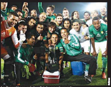
Los Esmeraldas se verán beneficiados con este acuerdo.

FELIZ CONVENIO El convenio entre Carlos Slim y Jesús Martínez se dio a través de América Móvil, una de las empresas del magnate mexicano con raíces libanesas. La participación de Slim en el